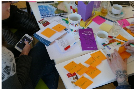
1Bei der Arbeit

Zahlreichen Schulen dient er als Grundlage und Leitfaden der Inklusionsentwicklung. In Form eines offenen Raumes wurden die Thesen mit viel Lebendigkeit und Intensität aufgenommen. Der erste Funke für die eigene Inklusionsentwicklung war gezündet.