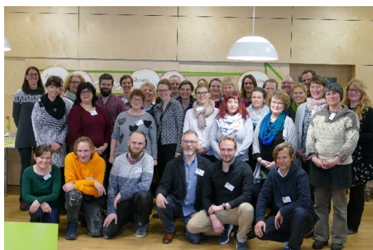
4Alle Teilnehmer der Auftaktveranstaltung